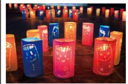
ランタンカバーに切り抜いた「ランタンマン」