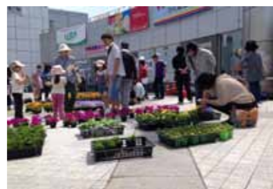
花苗を選ぶ来場者

集まったお金は、リヴォルヴ学校教育研究所を通して、宮城県東松島市の小中学校の花苗代に使われる予定です。