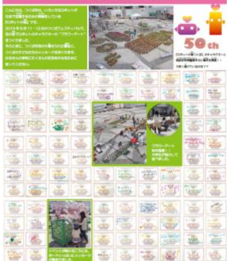
▲東松島へのメッセージポスター