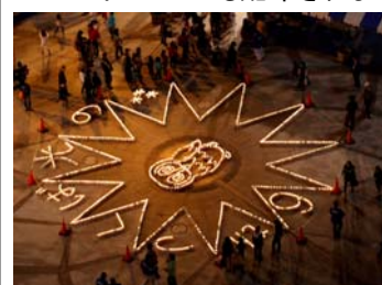
▲センター広場での「つくば光の森」点灯式で灯された廃食用油ランタンで形作った「ツクツク」

1月10日まで実施された「つくば光の森」「光のアート」「光のメリーゴーランド」の駅前にぎわい創出事業や「ランタンアート」など、イルミネーションの美しいセンター地区にもっと足を運んで楽しんでいただこうと、「つくば Winter イルミネーション」の案内マップを作成しました。このマップは11月27日より約2万部をTX各駅、センター地区内の商業施設、銀行、公共施設などで配布しました。さらに、茨城県観光物産課などの企画による埼玉県・群馬県でのPRイベントでも配布されました。