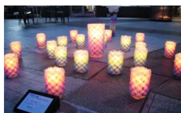
▲最優秀賞の「夢の架け橋」風船を編んで作ったランタンが幻想的でした。