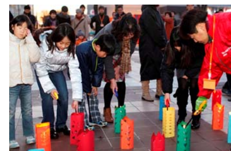
▲点灯式では市民と会員がともに火をつけました。

ろうそくの灯が約3時間半で燃え尽きてしまうため、19時半に消しましたが、「まだろうそくが残っているのにもったいないね」と名残を惜しむ声が聞かれました。